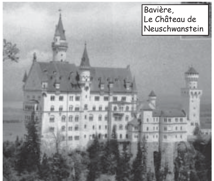
Bavière, Le Château de Neuschwanstein

Ainsi se terminent les activités de l'année 2001, riche de bons souvenirs et souvent de découvertes passionnantes. Nous espérons pouvoir garder cette qualité en 2002.