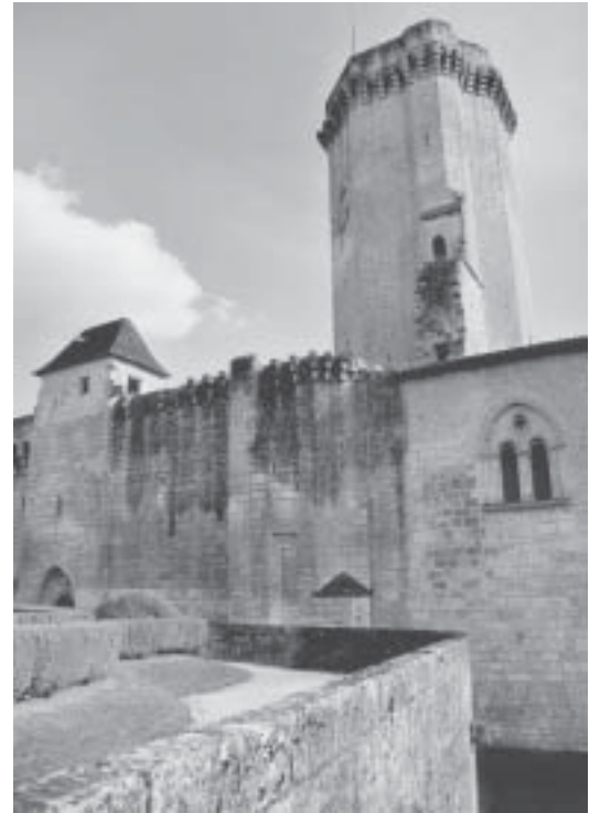
Le château de Bourdeilles