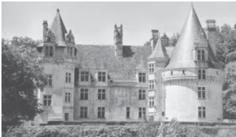
Le château de Puyguilhem

Pour autant, la journée n'est pas terminée et nous voilà de nouveau sur la route en direction du Château de Bourdeilles, où là encore le temps ne va pas nous sembler long. Nous visitons la partie Renaissance du château, sous la conduite d'une jeune femme qui connaît parfaitement tous les aspects de cette belle maison et nous permet avec beaucoup