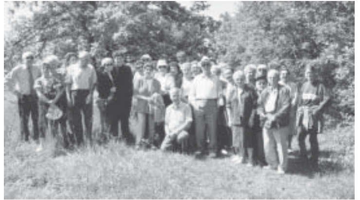
Le groupe landais