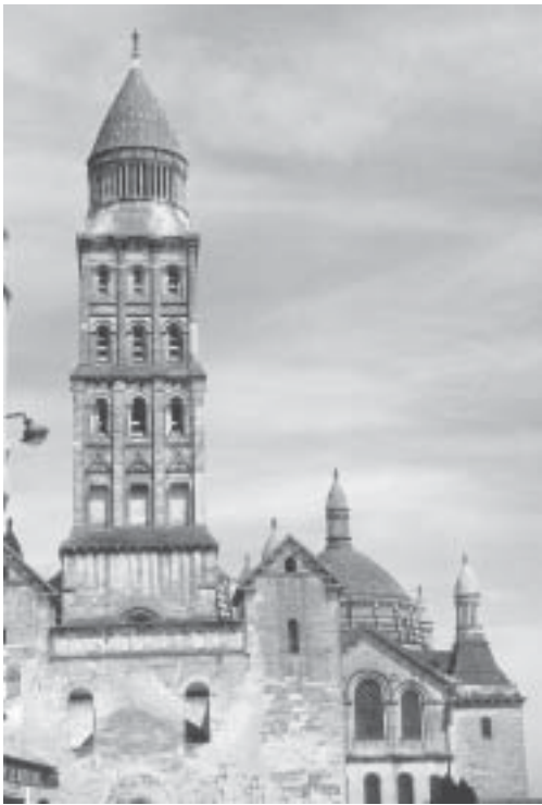
La cathédrale Saint Front

Notre deuxième journée en Périgord, s'annonce sous les meilleurs auspices, le soleil est déjà tout près de percer les petites brumes du matin qui recouvrent encore les berges de la rivière, le petit déjeuner est vite expédié, et tout le monde est présent à l'heure prévue pour embarquer dans notre car vers les chemins de la truffe. A travers les collines et les vallées du Périgord vert, nous sommes rapidement arrivés à SORGES. La capitale de la truffe est un tout petit village, son musée de la truffe y tient une place primordiale. Nous y sommes accueillis par une responsable très soucieuse de bien faire découvrir cette richesse mythique, et pour la plupart d'entre nous totalement inconnue. A travers présentations murales, diaporama, projection vidéo, nous allons acquérir de bonnes notions de bases, mais nous avons aussi l'impression, que notre guide ne nous montre que ce que les scientifiques et les chercheurs sur le sujet ont déjà largement vulgarisé, les secrets des "chercheurs de truffe" du coin, les bons gisements, les bonnes truffières, ne seront pas dévoilés à partir du musée, et tous les mystères qui entourent ce champignon invisible resteront soigneusement dissimulés. Nous ne sommes pas près de trouver des truffes ! Cependant nous partons après la visite du musée vers le chemin des truffières.