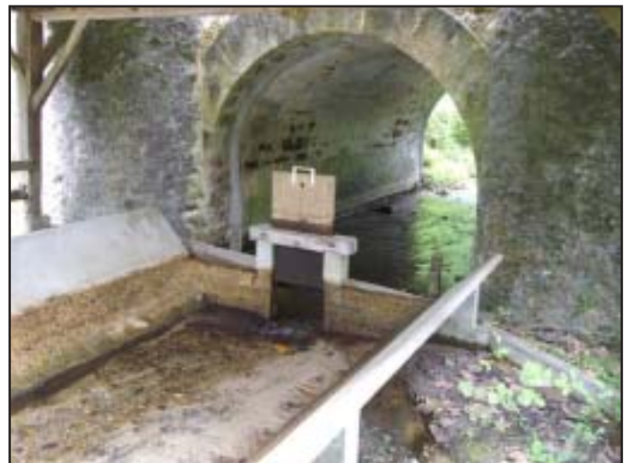
Lavoir à Escource

* Les "vrais" Landais me pardonneront cette petite plaisanterie... L'Espezonnette se trouve bien à Lespéron commune Ardéchoise (et non pas Lesperon), mais la photo était si belle !