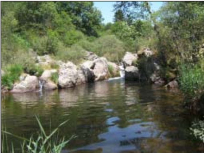
L'Espezonnette à Lesperon *

Bercé par le léger clapotis de l'eau, les murmures des feuilles agitées par la brise et les appels des oiseaux, je me sentais si heureux sur mon perchoir de la rive,