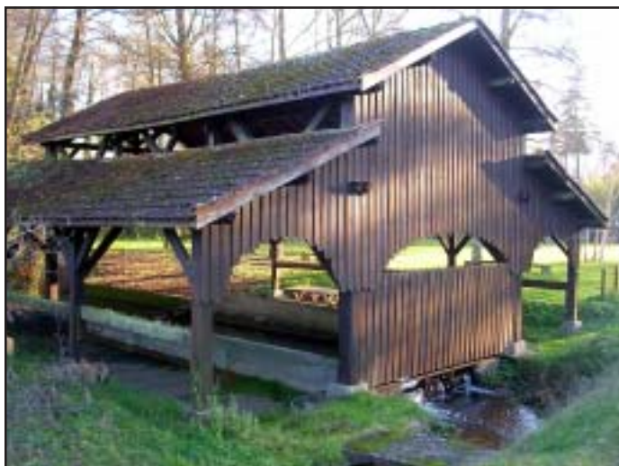
Lavoir de Labouheyre

Ma mère s'y rendait chaque jour, soit à la fontaine, soit au lavoir. Et j'avais le cœur gros quand elle me défendait fermement de l'accompagner alors qu'à la cuisine, au jardin, le petit bonhomme de quatre ans que j'étais, ne la quittait pour ainsi dire jamais.