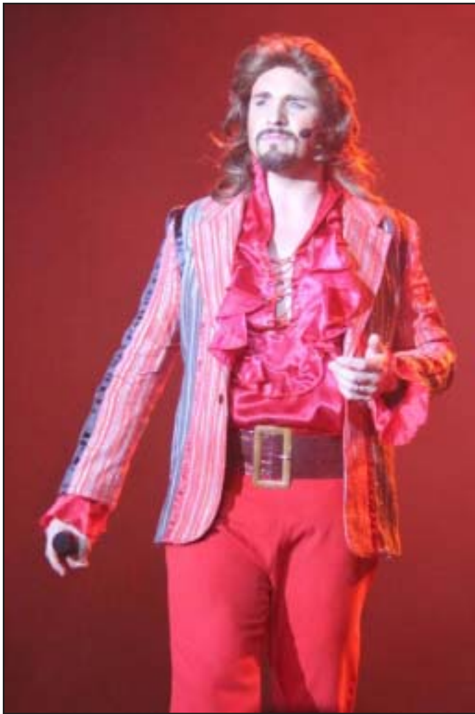
Mike BRANT plus vrai que nature !

véritable voyage de rêve, l'Irlande, le Brésil, l'Espagne,... Le soleil est dans nos cœurs et nos rêves, et nous nous surprenons, les uns et les autres, tout au cours de l'après-midi, à fredonner les différents airs.