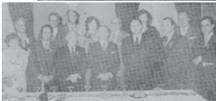
Le premier bureau et les médaillés de 1977 Cherchez : il y a des visages bien connus...